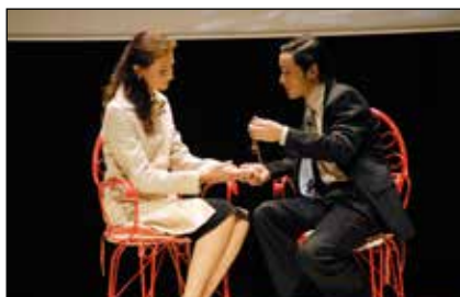
Estrena de l'obra al Teatre de l'Acadèmia Mariana de Lleida, el 26 d'octubre de 2006 amb motiu de la seva restauració